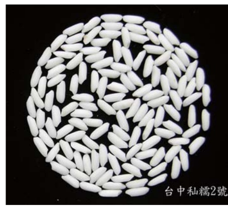
■ 台中私糯2號之白米