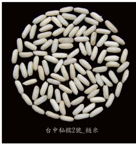
■ 台中私糯2號之糙米