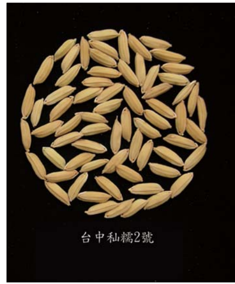
■ 台中私糯2號之稻穀