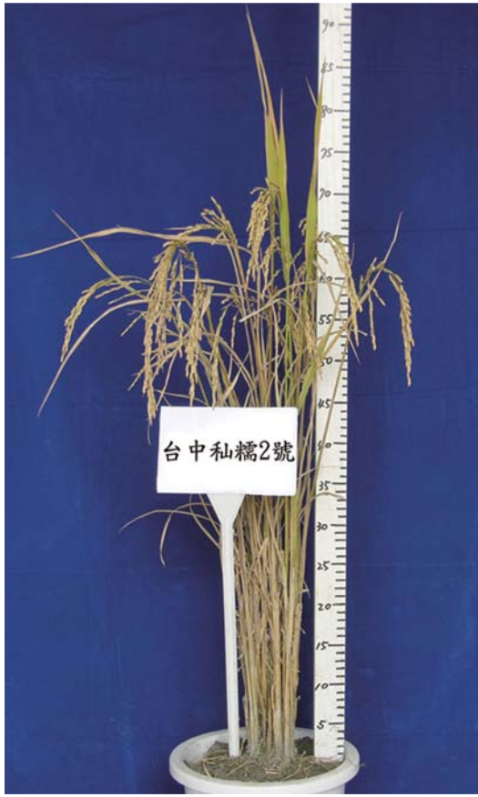
■ 台中私糯2號之單株