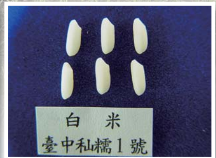
■ 台中私糯1號之白米