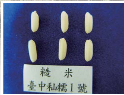
■ 台中私糯1號之糙米