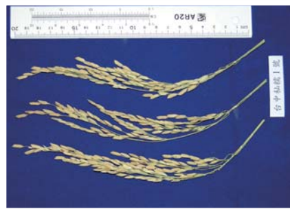
■ 台中秈糯1號之稻穗