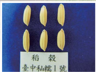
■ 台中私糯1號之稻穀