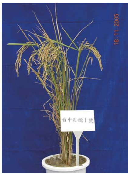
■ 台中秈糯1號之植株

本品種具有半矮性、高產、抗（耐）多種病蟲害等優良特性，且糯米品質優良，製成的粿類等米食製品不會有「灶腳軟」的現象。命名推廣後，廣受農民喜愛，栽培面積急速增加，1985年起即成為台灣秈糯稻栽培面積最廣的領先品種，也因為此種推廣成就，本品種相關育種人員曾獲得台灣省農業發展獎。本品種迄今仍佔有台灣秈糯稻近80%的栽培面積，主要於台中、彰化、雲林、台南等縣市種植。依現有資料，種植情形如下：