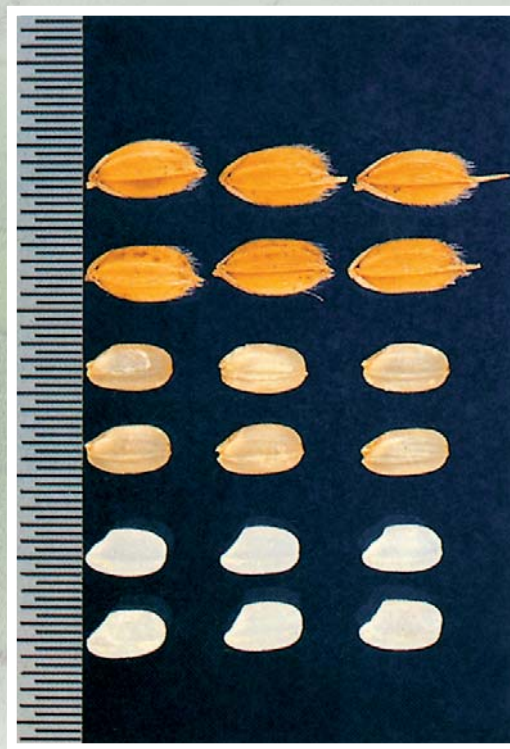
■ 豐錦之稻穀、糙米、白米