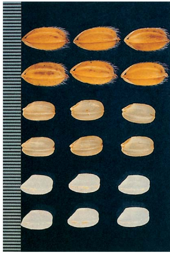
■ 台中180號之稻穀、糙米、白米