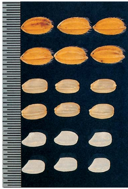
■ 台中170號之稻穀、 糙米、白米