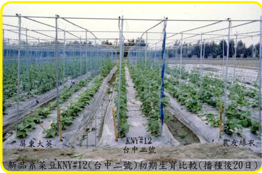
新品系菜豆KNY#12(台中二號)初期生育比較(播種後20日)