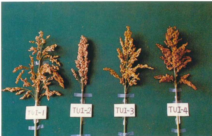
圖二 不同單寧含量同源系之穗型從左至右為 TUI-1, TUI-2, TUI-3, TUI-4

四個同源系之穗型如圖二所示，分別為小穗枝梗下垂之極散穗型，小穗枝梗直立散穗型，小穗枝梗直立中散穗型與小穗枝梗下垂微散穗型。