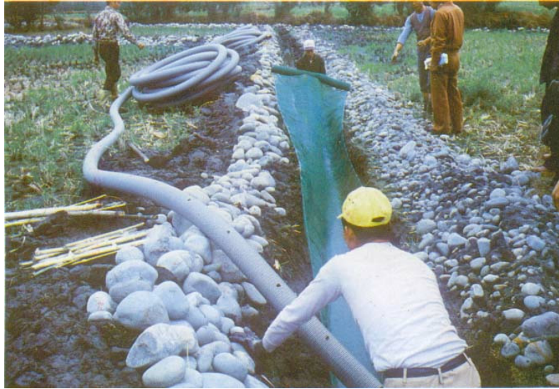
圖一、按照適當之間隔、寬度、深度、及坡度挖好排水溝之後即開始埋設塑膠浪管。

砂，最後填上原挖出之田土，踏實，另外在每100 m處之浪管連接處用水泥涵洞通到地面，浪管之尾端則用塑膠管通到地面，以利通氣及灌洗。