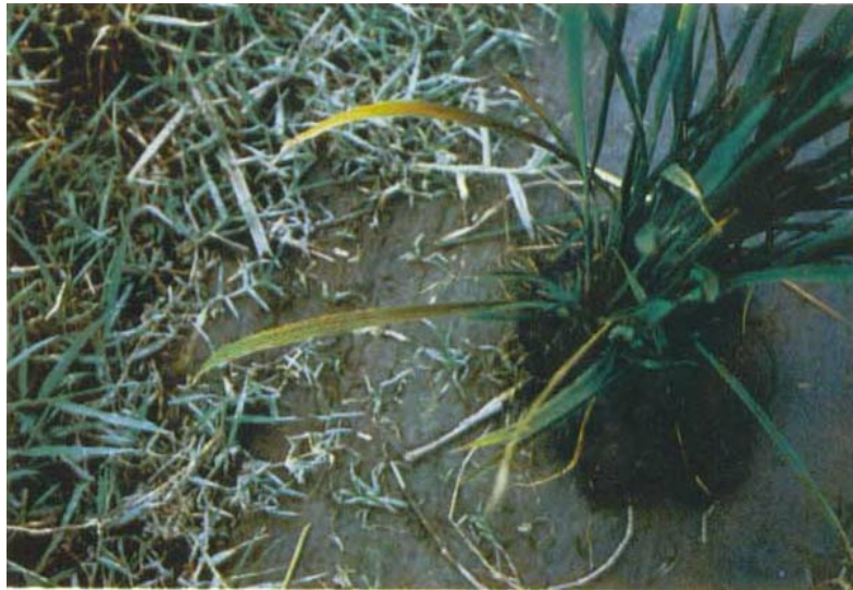
圖四、未排水對照區稻株呈藍綠色，老葉有許多細小之褐色斑點是一種鐵過多而鉀銅缺乏所引起之毒害症狀。