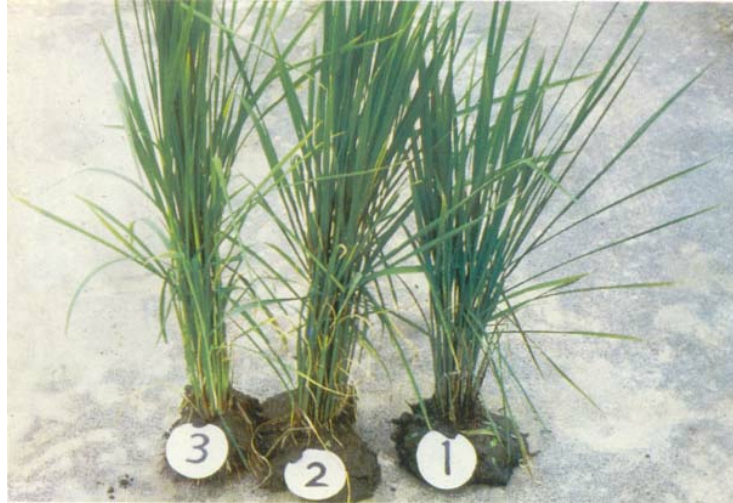
圖三、①未排水對照區之稻株明顯地矮化，而②埋設塑膠浪管區，及③埋設塑膠浪管並施穀殼區之稻株生長均正常。