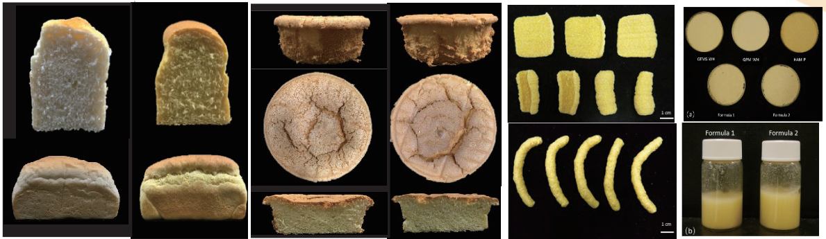
圖2、以國產高直鏈澱粉玉米澱粉及以HAM與QPM全穀粉與開發之產品 [27, 34, 35]。