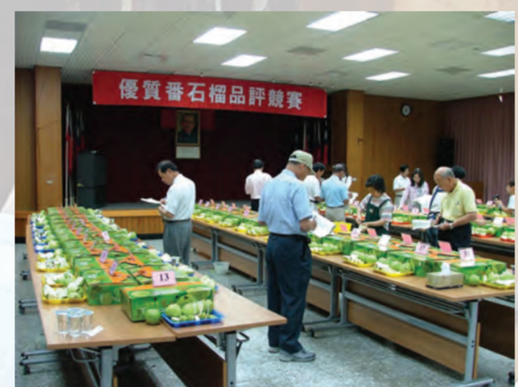
▲品評小組努力找出好果品