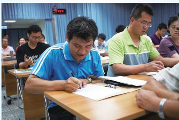
▲青年農民在各單位人員的見證下簽訂輔導同意書