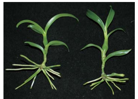
▲圖1.莖節培養在步驟3之培養基的情形 ▲圖2.莖節培養60日之情形