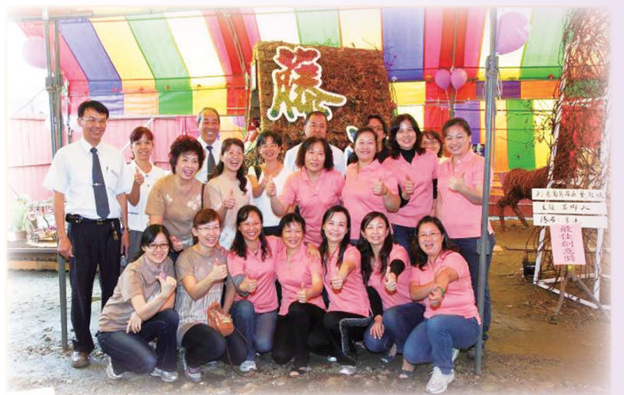
▲大村鄉農會第17班家政班充滿活力與快樂

更具文化與藝術色彩。集眾多才藝於一身之班員，以葡萄多元創作-葡萄藤植物染、葡萄多酚手工皂、葡萄創意農產品(果醬、烘焙產品等)，並延伸將葡萄藤植物染布製作百寶袋，再搭配葡萄多酚手工皂組合產品等，打造屬