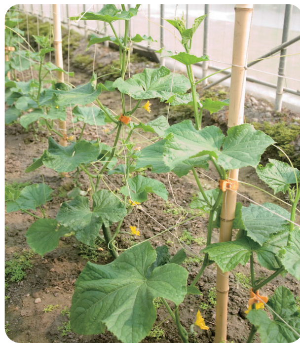
施用中性化亞磷酸防治胡瓜白粉病之情形