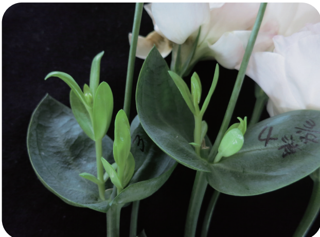
「愛花彩」保鮮劑瓶插能維持洋桔梗切花活力，甚至冒出新芽