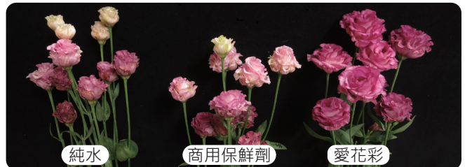
相同切花使用不同保鮮劑瓶插結果，「愛花彩」能表現最佳的花蕾開放度與花色，優於主流商業保鮮劑