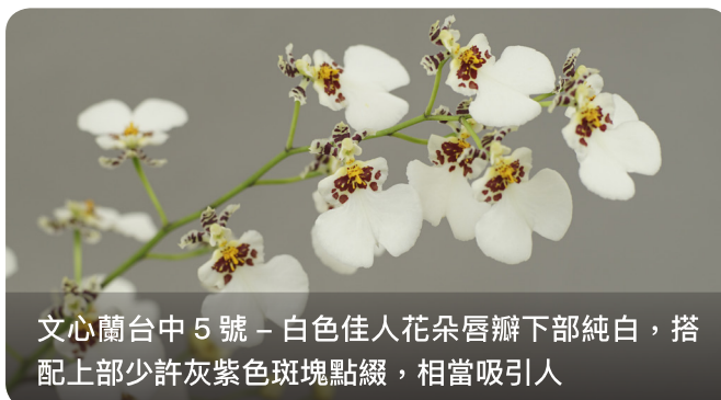
文心蘭台中 5 號 – 白色佳人花朵唇瓣下部純白，搭配上部少許灰紫色斑塊點綴，相當吸引人