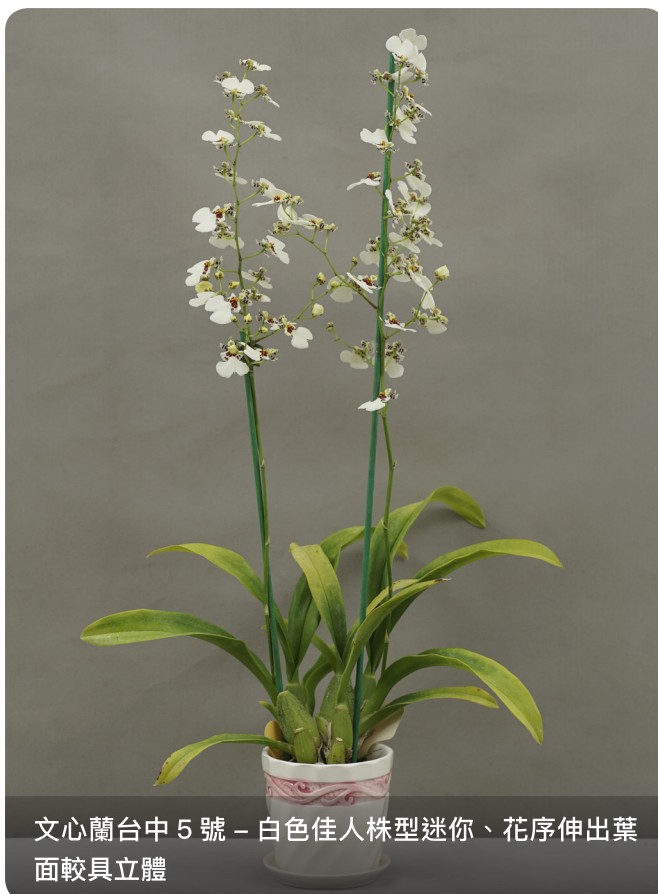
文心蘭台中 5 號 – 白色佳人株型迷你、花序伸出葉面較具立體