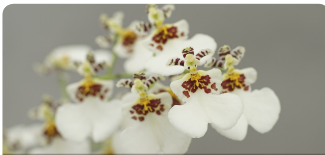
文心蘭台中 5 號 – 白色佳人為白花系讓人耳目一新