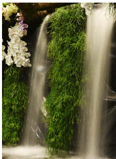
▲ 銀色水簾傾瀉而下，瀑布流水聲盈耳，導入負離子科技於庭園舒壓

盛邀您暫緩腳步、悠遊駐足，以不同角度與視野欣賞眼前美景，聆聽水瀑樂音、鳥鳴相和，恣意感受豐沛水霧霏微撲面，瀑布水氣清涼與負離子能量，頓覺神清氣爽，由洗滌紛擾，察覺、觀照身心靈，到沉澱自我，回歸單純初心，臻至內心澄靜，產生觀心習定，平息妄念之領悟。