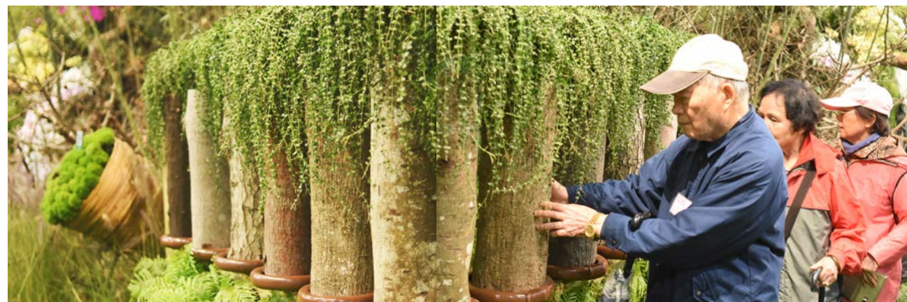
▲ 透過指尖直接觸摸樹幹硬實、光滑或粗糙等質地，感受樹木歷經歲月歷練、滄桑，刻劃出蒼勁嶙峋之美