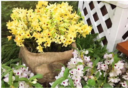
▲ 春天來的指標 石斛蘭相當吸睛

高雄場多花色嫁接技術，將不同花色、花形的朱槿品種嫁接於同株植株上，讓單一盆栽每天開不同顏色花朵，或讓多花色同時綻放，創造朱槿多樣風貌。臺南場培育之文心蘭新品系香美人，貌似穿著紫紅色塊斑滾邊上衣白裙下擺，迴旋輕舞曼妙唇瓣蝶形身影，贏得跳舞美人撲鼻香之美譽。蝴蝶蘭臺南 1 號有如煥發高雅氣質的白蝴蝶，娉婷展現典雅丰采。臺東場石竹兩新品種 " 香粉雲 " 與 " 香怡夏 " 叢生綻放著不規則鋸齒裂紋、色彩漸量層次的綺麗花朵。農試所培育之各種火鶴花，於形如粉紅掌佛焰苞中豎起花燭，花葉俱美，丰姿楚楚動人。桃園場選育的黃根結蘭，花色鮮黃亮麗，帶有檸檬清香，花型清新脫俗，此臺灣原生蘭在花明區花現芳蹤，挹注純淨色調，讓瑰麗多彩景致更加增色。