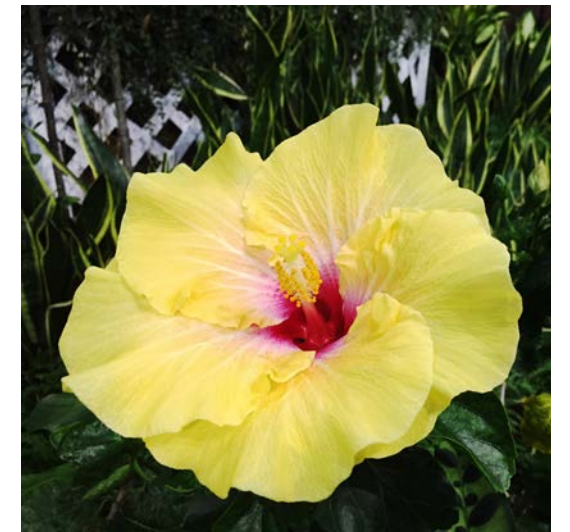
▲ 朱槿花開復謝，碩彩燦爛 ◀ 臺南 1 號蝴蝶蘭有如煥發高雅氣質的白蝴蝶

各農業試驗場所育種有成，展現雄厚研發能量，各自推出優質品種(系)在花明區亮麗登場，包括種苗場孤挺花；臺南場蝴蝶蘭、文心蘭；農試所火鶴花；高雄場朱槿；臺東場石竹；桃園場黃根結蘭及石斛蘭等展品。以「花明」為題，繽紛盆花錯落有致，搭配綠色植被，花葉恣意吐納伸展，處處盡是花開燦爛、異卉爭妍美景，漫步其中來場浪漫賞花之約，感受花朵所傳遞花語與能量，足讓人由蹙眉轉為歡顏。