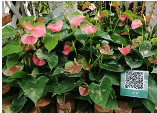
▲ 火鶴花叢中拈花惹草，花葉俱美，丰姿動人

藉由花顏巧色、花狀形貌，創造視覺美學亮點，形成千嬌百媚、花舞爭豔之鮮明對比，這是一場賞心悅目、美不勝收之視覺饗宴，在移步換景中充滿花漾綻放的多重景致，於尋覓回眸時享受悅目清心之審美愉悅，詮釋出柳暗花明般驚豔，轉彎處別是一番風景，鋪陳出觀展者美麗心境與浪漫想像。