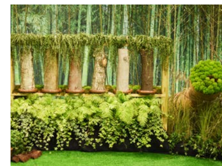
▲ 木麻黃、大葉山欖、楓香、樟樹、構樹、油桐等樹幹轉輪 (右到左)

獨具匠心在佈滿常春藤與腎蕨上方、綠藤下方置放木麻黃、大葉山欖、楓香、樟樹、構樹、油桐等不同樹幹轉輪，試圖從樹皮分裂剝落形狀、枝幹斑駁紋理，透過指尖直接觸摸其硬實、疏鬆，抑或光滑、粗糙等質地，感受樹木歷經歲月歷練、滄桑所刻劃出蒼勁縱裂、嶙峋樸拙之美。旋轉此樹幹轉輪，仿如旋轉經輪般觸動心靈有所感悟，正視內心深處最真實自己，在頓悟中因而禪了心境，臻至獲得心境平靜無瀾，萬物自然得映；心情靜極而定，剎那便是永恆之感受。