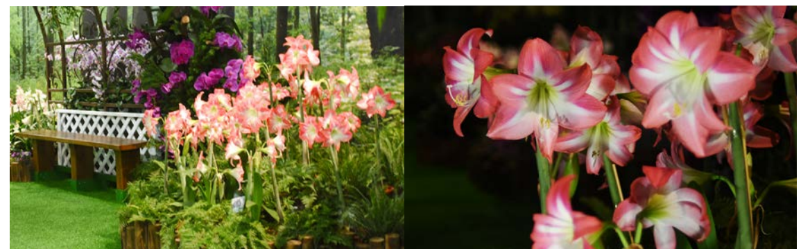
▲ 孤挺花綻放嬌顏，誘人俯身欣賞

各農業試驗場所育種有成，展現雄厚研發能量，各自推出優質品種(系)在花明區亮麗登場，包括種苗場孤挺花；臺南場蝴蝶蘭、文心蘭；農試所火鶴花；高雄場朱槿；臺東場石竹；桃園場黃根結蘭及石斛蘭等展品。以「花明」為題，繽紛盆花錯落有致，搭配綠色植被，花葉恣意吐納伸展，處處盡是花開燦爛、異卉爭妍美景，漫步其中來場浪漫賞花之約，感受花朵所傳遞花語與能量，足讓人由蹙眉轉為歡顏。