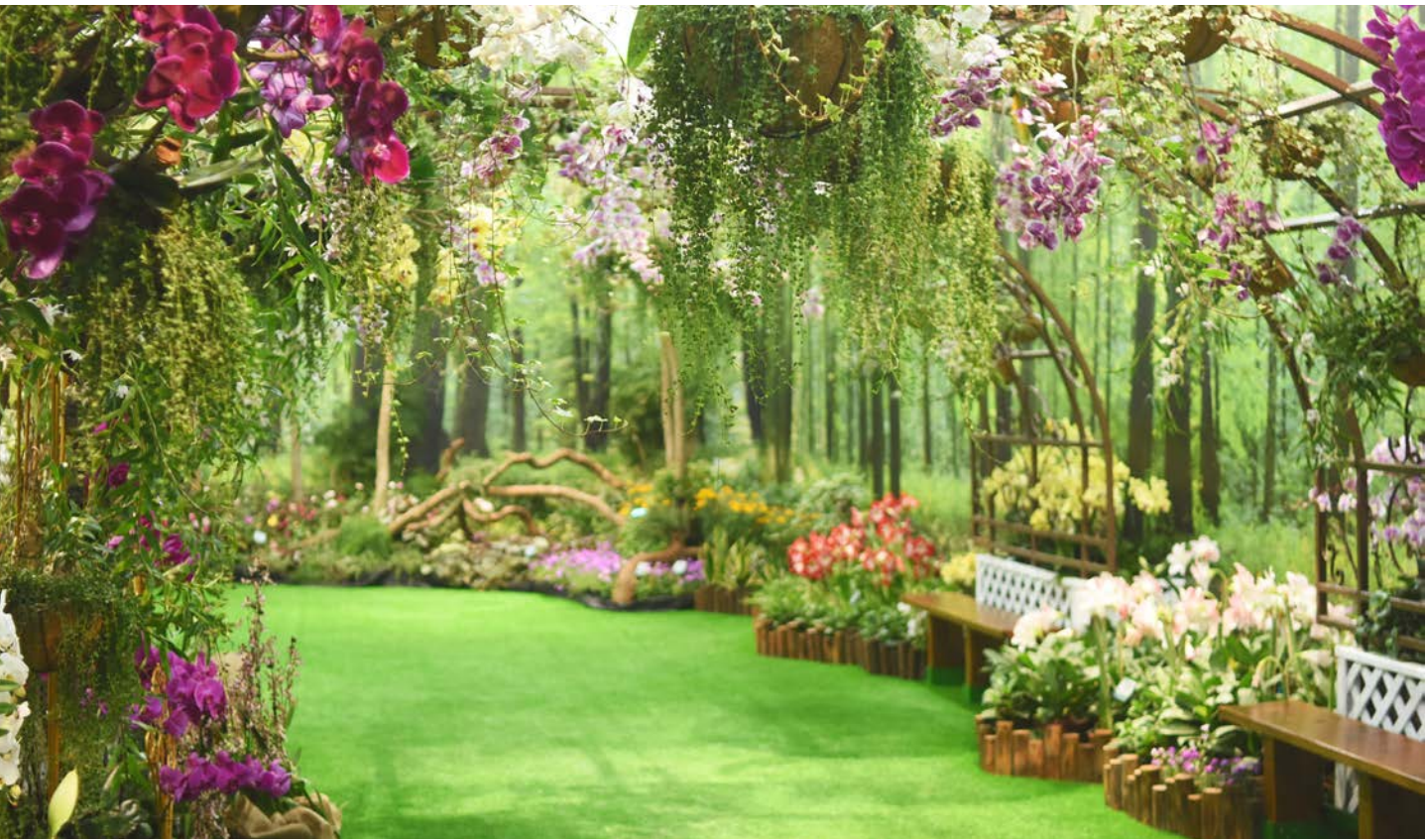
▲ 以多元品項蘭花植栽與綠懸植物打造繽紛花廊，賞花之際亦體驗植物之美

療癒庭園由臺中場統籌，巧妙運用花藝園林造景與農業研發成果，打造出柳暗、花明、悸動、頓悟、安神等五小區，不僅邀請國人透過眼耳鼻舌身意，接受顏色、形狀、香味及接觸等多元感官互動刺激，帶來視覺、聽覺、嗅覺及觸覺等豐富體驗，心境亦因而感知。在各種不同療癒主題引領下，激盪感官，放鬆心情、濡染心境，享受感官齊揚之美，透過感官來認識及瞭解農業，體驗農業帶來的樂趣與療癒成效。