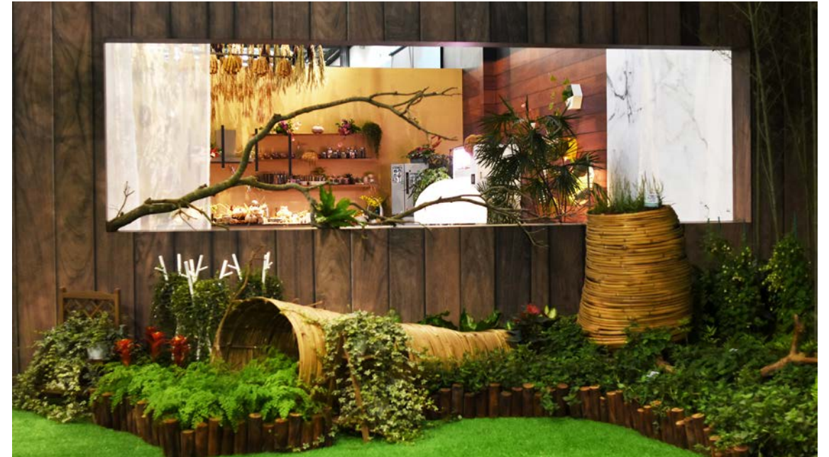
▲ 種下藥用植物傳奇，品嚐藥草寧心安神之效

各場投入具發展潛力之本土性藥用保健植物，發展為適地適作生產「道地藥材」，透過本展區推廣宣導安全中草藥植株與食材功用，讓民眾了解藥食同源、引藥入經，體會品嚐藥草帶來的寧心安神、安頓身心之效。