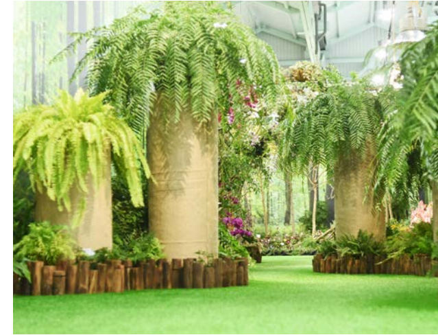
▲ 以蕨類、綠色植栽為主，進行層次堆疊