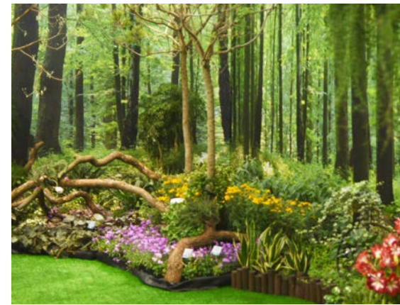
▲ 悸動區以探索花香味道為主