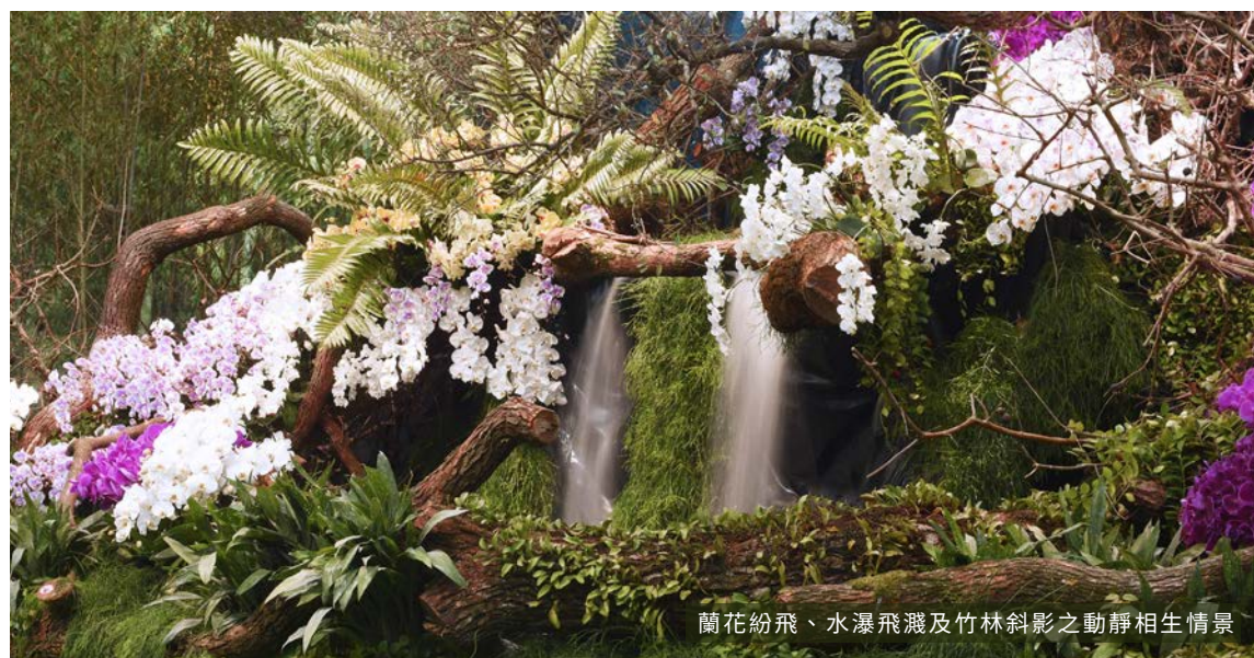
蘭花紛飛、水瀑飛濺及竹林斜影之動靜相生情景