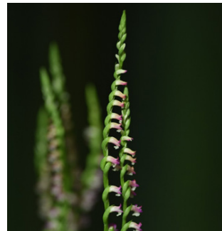
▲ 臺灣最迷你雅緻兼屬民俗草藥的綬草