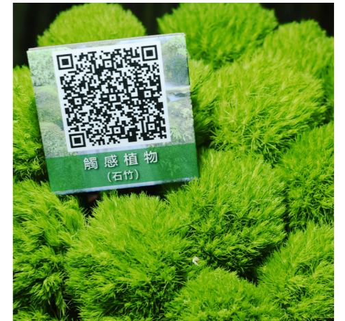
展項訊息說明是利用手機掃描 QR Code ▶

經過多次討論並與其他展期內容區隔，將展示區劃分為療癒庭園、幽情雅室及休憩茗間，再分由臺中場、桃園場及茶改場協助佈展廠商規劃，彙整全國 12 個試驗改良場所提供展項，共 73 項育成品種、27 項農園藝創新技術暨特有生物保育中心音檔。臺灣蘭花產銷發展協會於 2018 年 12 月完成設計平面圖，本檔期以藝術手法展現，利用 QR Code 代替解說牌讓參觀民眾以手機掃描 QR Code 獲得展項訊息說明，藉此更了解各試驗改良場所之研發成果。