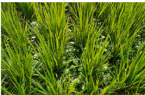
圖六、對照(未放植滿江紅)水稻田 40~45 天雜草滋生情形。