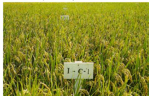
圖七、放植滿江紅之水稻成熟情形。