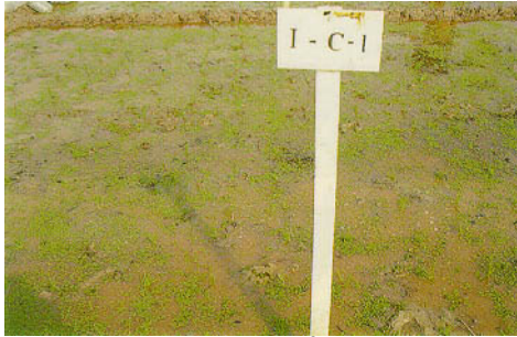
圖三、試驗放植 100g/m 2 滿江紅植體量。