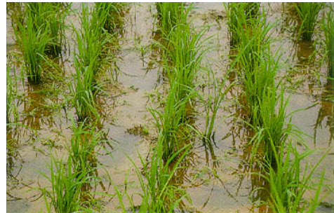
圖六、對照(未放植滿江紅)水稻田 20~25 天雜草滋生情形。