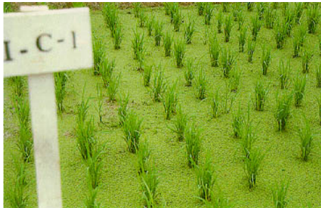
圖五、滿江紅施植 25~30 天後增殖覆蓋與水稻生育情形。