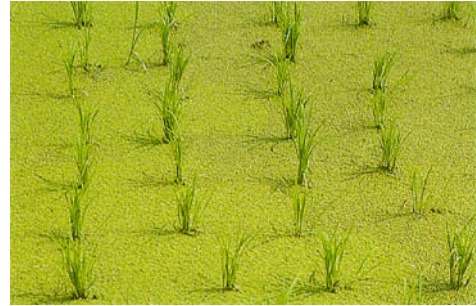
圖四、滿江紅放植 10~15 天後增殖覆蓋田面情形。