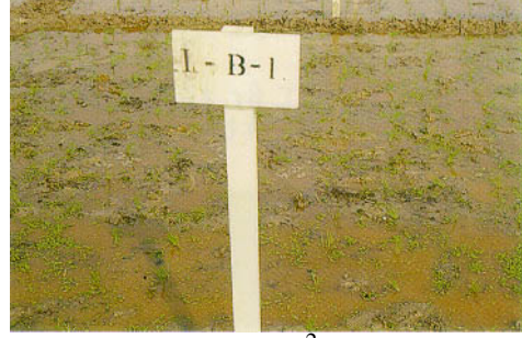
圖三、試區放植 50g/m 2 滿江紅植體量。