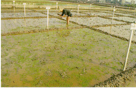
圖二、水稻插秧後即放植滿江紅撒播於稻田。