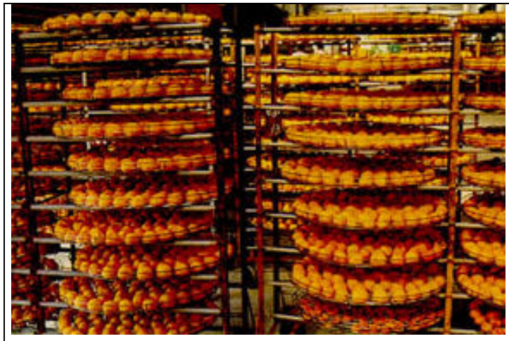
圖3.利用牛心柿製作柿餅