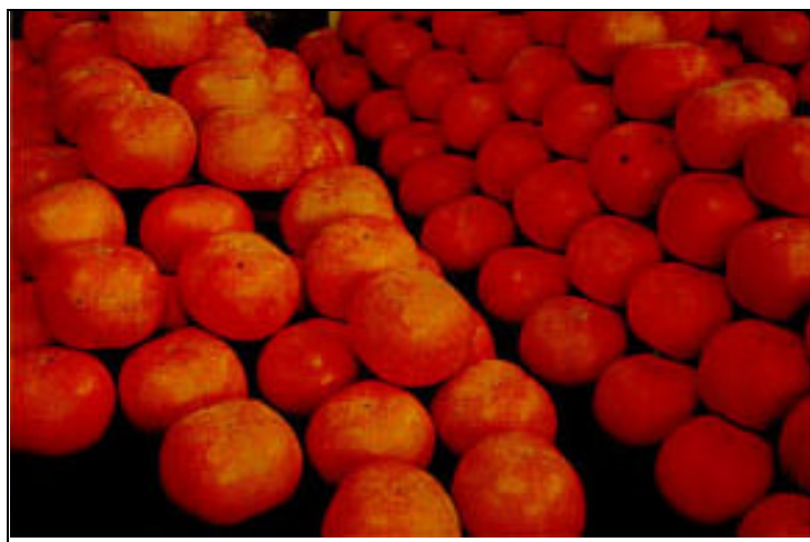
圖6.富有採收後分級進行包裝