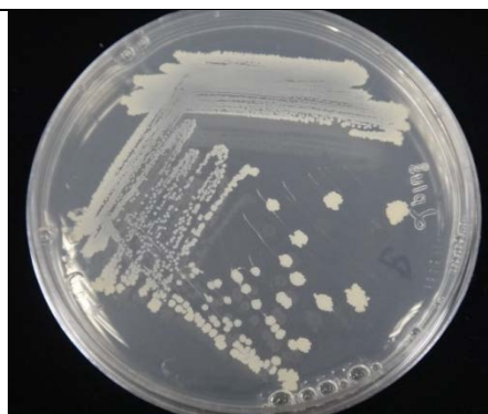
圖 1. Tcba05 菌株之菌落形態