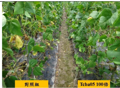
圖 4. 應用 Tcba05 菌株可有效防治镰孢病菌引起之菜豆萎凋病