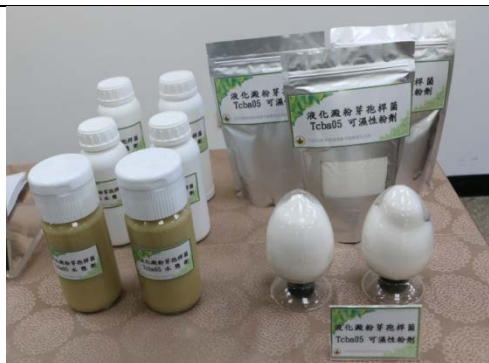
圖 3. Tcba05 菌株雙劑型之開發