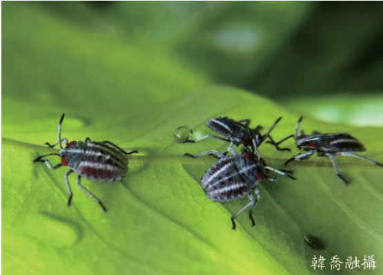
圖二、荔枝椿象若蟲與成蟲。