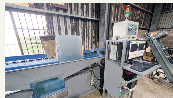
▲ 百香果視覺影像辨識分級機