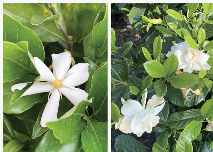
▲單瓣(左)與重瓣(右)梔子花

《神農本草經》記載梔子的果實、葉、花、根均可入藥，現代研究進一步發現，梔子果實中含有「梔子苷(Geniposide)」，具有抗發炎、抗氧化、降血糖及神經保護等功效。值得一提的是，傳統入藥多使用「山梔子」，而過去臺灣因染料產業興盛，大多種植的是「水梔子」。兩者外觀相似，容易混淆，主要區別在於山梔子果實較小且偏圓形（長1.4-3.5公分，種子團呈紅