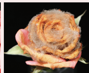
▲ 花瓣上覆蓋的灰色黴狀物為灰黴病的菌絲與孢子