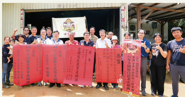
▲ 南投縣埔里鎮果樹（水果）產銷班第4班獲獎合影

為達資源永續利用，班透過百香果剩餘資源再利用，以果殼開發魚飼料與植物染等產品，提升資源循環利用價值，也結合食農教育、展售體驗及創立棚下市集活動，推廣在地優質農特產品。班內青農及女性班員分別占約25%及30%，展現青農與女力參與產業的活力，提升產銷班永續發展能力，故榮獲114年全國優良農業產銷班之殊榮。