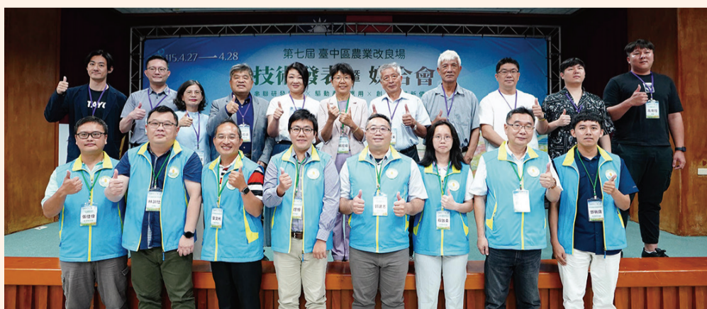
▲ 第七屆技術發表暨媒合會技術授權簽約儀式大合影