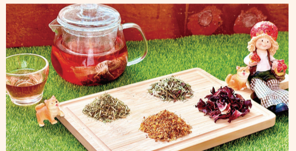
▲ 紫錐桂神茶微酸微甜

花草茶雖有保健潛力但非藥物，無法取代正規醫療。上述功效描述均基於植物化學成分與傳統中藥研究，