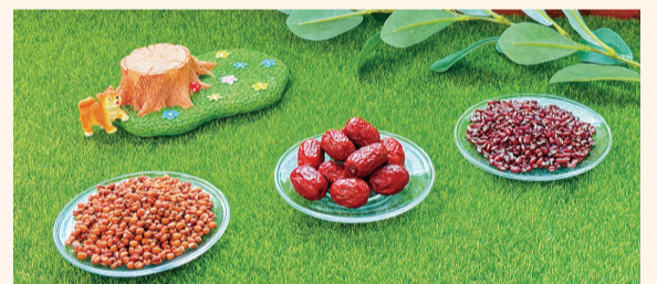
▲ 薏仁赤小豆茶，品嚐穀物的溫潤