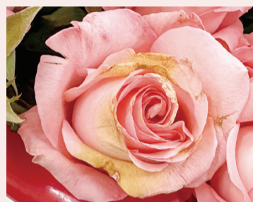
▲ 玫瑰灰黴病造成花瓣水浸狀褐化

此外，本場近年篩選出非農藥防治資材 - 次氯酸水，經證實能有效降低採收後灰黴病的發生，不僅提升防治效能，更為玫瑰的生產與觀賞品質提供了兼具安全與科學的強大後盾。