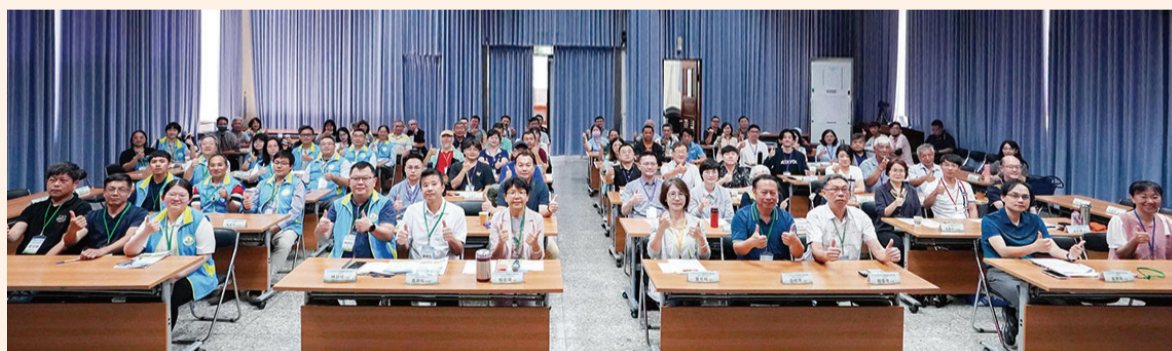
▲ 本場第七屆技術發表暨媒合會與會人員合影

本場自109年起辦理媒合會至今已邁入第七屆，本屆活動成果斐然，共吸引企業及農民團體101家次參與，技轉案件量及授權金額穩定成長，顯示本場研發成果能精準對接市場需求，有效解決產業痛點，亦感謝業者肯定本場研發成果，讓本場未來能夠開發更具實用與市場需求的技術。各項最新技術移轉資訊公告於農業部農業技術交易網與本場官網，歡迎對技術與授權業者資訊有興趣者可查詢。