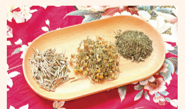
▲ 薄荷洋甘菊茶清新紓心