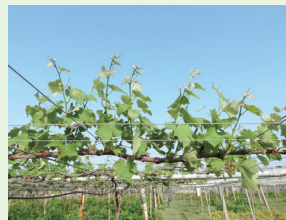
▲ 葡萄'安藝皇后'採 H 型整枝，短梢修剪萌芽整齊且結果枝帶有花穗