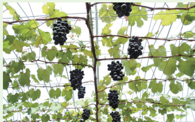
▲ 葡萄'巨峰'利用一字型整枝節省田間操作時間