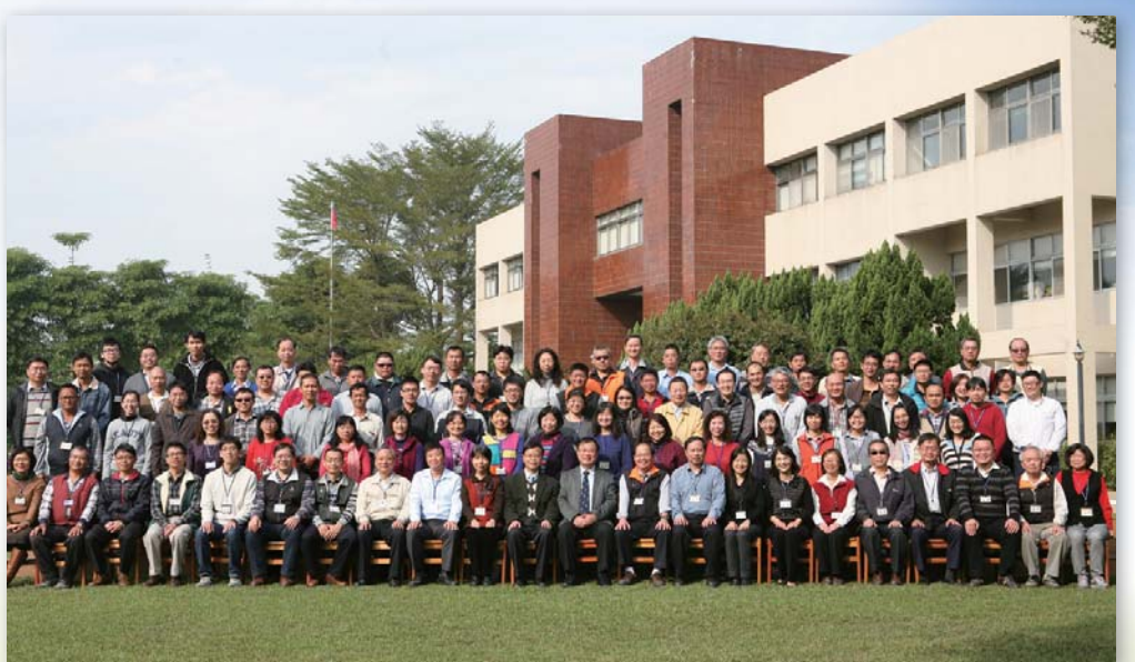
▲104年1月12日陳主任委員蒞臨本場業務指導(參與103年公務人員高普考集中實務訓練開訓典禮)席間撥冗勉勵同仁並與同仁合影留念