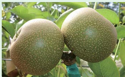
▲南水梨中果期果形圓整偏扁