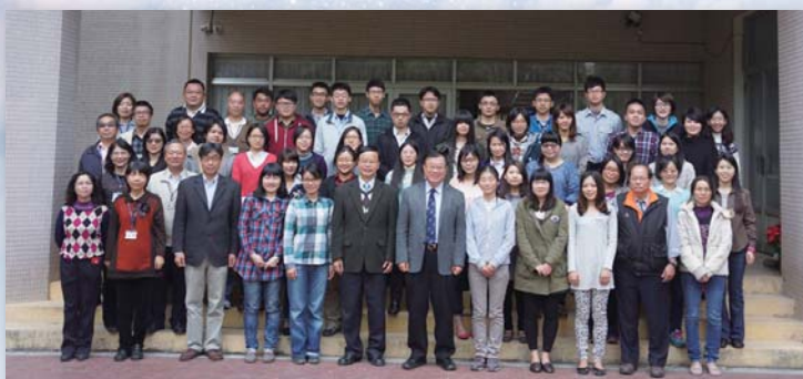
▲「103年公務人員高普考試農業相關類科專業知能集中實務訓練」開訓學員與農委會陳保基主任委員、本場林學詩場長等人合照