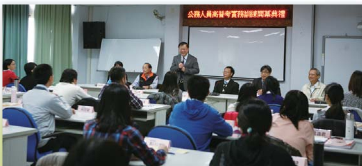
▲陳主委期勉38名參訓學員一本應試初衷，秉持服務精神融入「創新」觀念戮力從公，將「服務」定位為公門修行的第一要務