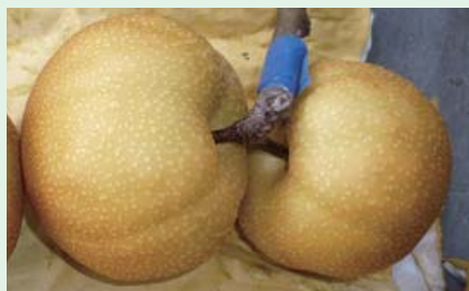
▲南水梨高接果型偏扁，表面有縱溝