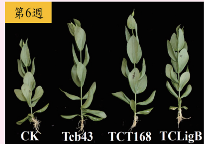
▲ 微生物製劑處理對洋桔梗‘女王白’生長之外觀表現

本試驗探討澆灌 3 種微生物製劑對促進洋桔梗生長及切花品質之影響。澆灌貝萊斯芽孢桿菌 Tcb43 及木黴菌 TCT168 製劑可提高洋桔梗株高及地上部鮮重，田間開 3-7 朵花之開花率，以施用地衣芽孢桿菌 TCLigB 製劑之 65% 及木黴菌 TCT168 製劑之 95% 為最佳，顯著高於對照組 0%。第 8 天切花瓶插性狀之分析結果，顯示以菌株 Tcb43 製劑具較佳之開花率，且花苞萎凋率顯著低於對照組。第 15 天切花瓶插結果顯示菌株 TCT168 製劑之開花率與鮮重顯著高於對照組，而花苞萎凋率則顯著低於對照組。施用木黴菌可顯著提高多種元素含量，其中磷、銅及鋅含量於葉、莖及花中皆顯著提升，試驗結果顯示施用木黴菌 TCT168 製劑具最佳提升洋桔梗切花品質之效果。