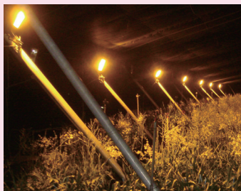
▲電照補光配合除芽技術可於 2-4 月生產高品質文心蘭切花

壓鈉燈補光技術，已於產業實際應用。此外，本場亦研究高光度 LED 燈具在文心蘭瓶苗出瓶後進行補光促成栽培應用，可以使穴盤苗的株高與假球莖發育明顯提升。然而，補光技術應用需增加電費與燈具架設費用，故產業實際運用需考量成本效益。近年，本場積極研發補光技術結合環境感測器與自動控制器等系統，期望能有效提升能源應用效率與精準補光技術。