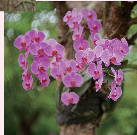
▶樹植位置以胸高以上較能呈現蝴蝶蘭開花姿態之美