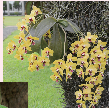
▲黃花品種花色亮眼，往往能吸引第一眼目光