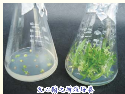
文心蘭之增殖培養