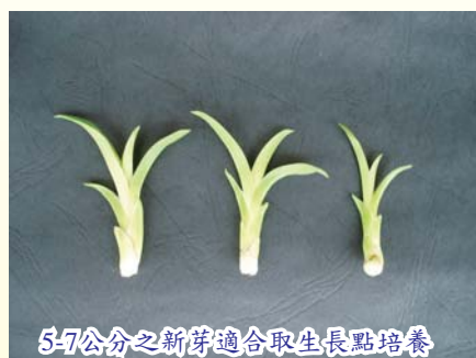
5-7公分之新芽適合取生長點培養