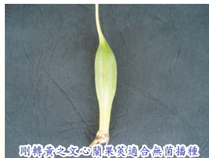
剛轉黃之文心蘭果莢適合無菌播種