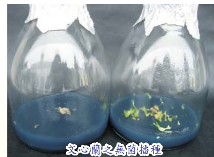
文心蘭之無菌播種