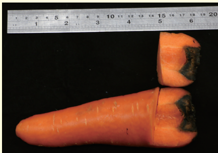
▲ 該胡蘿蔔樣本切開黑腐部位之縱剖面，黑腐病徵有往下蔓延趨勢