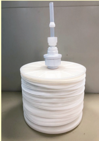
▲ 市售超濾膜為本試驗載體

試驗以萵苣‘明豐三號’為材料，將腐霉菌及疫病菌以菌絲塊方式接種在水耕養液中，並以超濾膜進行過濾，測試超濾膜在水耕栽培之效用。結果顯示，超濾膜能有效地隔離腐霉菌及疫病菌菌落，分別從 20 cfu/ 毫升及 30 / 毫升降低至 0 cfu/ 毫升。濾液栽種萵苣後，植株生育表現正常，雖無統計上顯著差異，但 Pythium 處理在株高、地上部鮮重與地下部鮮重，分別為 46.0 公分、68.7 公克與 19.3 公克，均較過濾前處理高，顯示超濾膜可作為克服水耕養液感染病原菌有效方法之一，未來可推廣應用於農業養液栽培之應用。