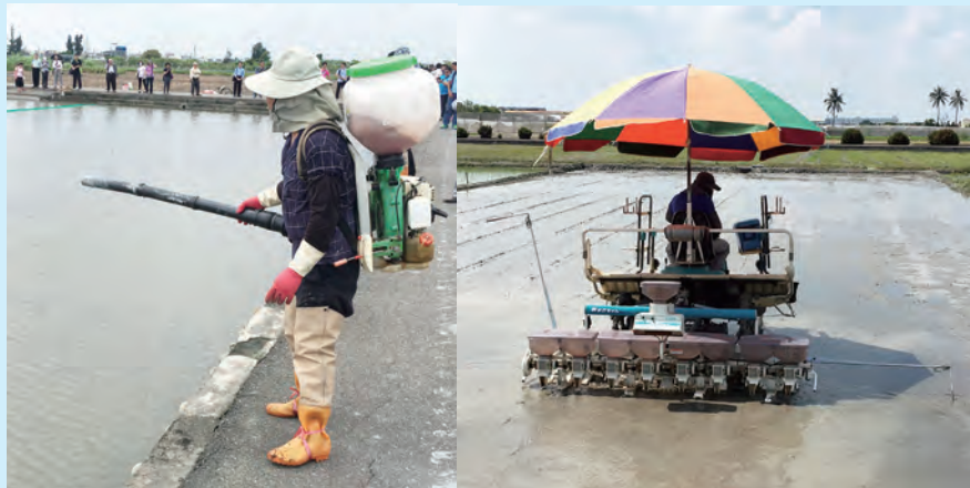
▲水稻直播播種方式有動力機械撒播(左)與直播機械點播(右)

水稻直播栽培方式可省去育苗階段之勞力，節約生產成本。然而，直播栽培易遭遇發芽率低、雜草、倒伏、鳥害等挑戰，因此栽培管理亦須進行調整，以克服上述問題。由於直播方式之田間栽培期較移植栽培久，故二期作建議提早至7月初開始整地，整地包括1次乾整地與1次濕田整平，且由於平整與否攸關種子之發芽率，因此應確實進行整平。整平後維持湛水狀態，施用第一次除草劑(丁基拉草 15 公斤/公頃)，以預防雜草發生。整平後 2-3 天進行播種，播種量為 50 公斤/公頃，播種方式可選擇機械撒播或直播機點播，前者須在湛水狀況下進行，後者則在播種前一天排去田水之下操作機具進行。播種後進行 5-7 日之湛水與施用苦茶粕，目的分別是浸潤種子與防治福壽螺。接著在種子出芽後進行 5-7 日之排水，以促進種子呼吸與葉片綠化。之後再進行 5-7 日之湛水與施用第二次除草劑(量同第一次)，待達到 4 葉苗齡之後進行間歇灌溉 7 日，以避