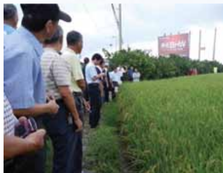
水稻合理化施肥講解，農友反應熱烈