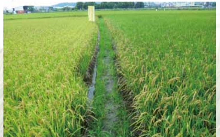
水稻合理化施肥田間生育良好(左)