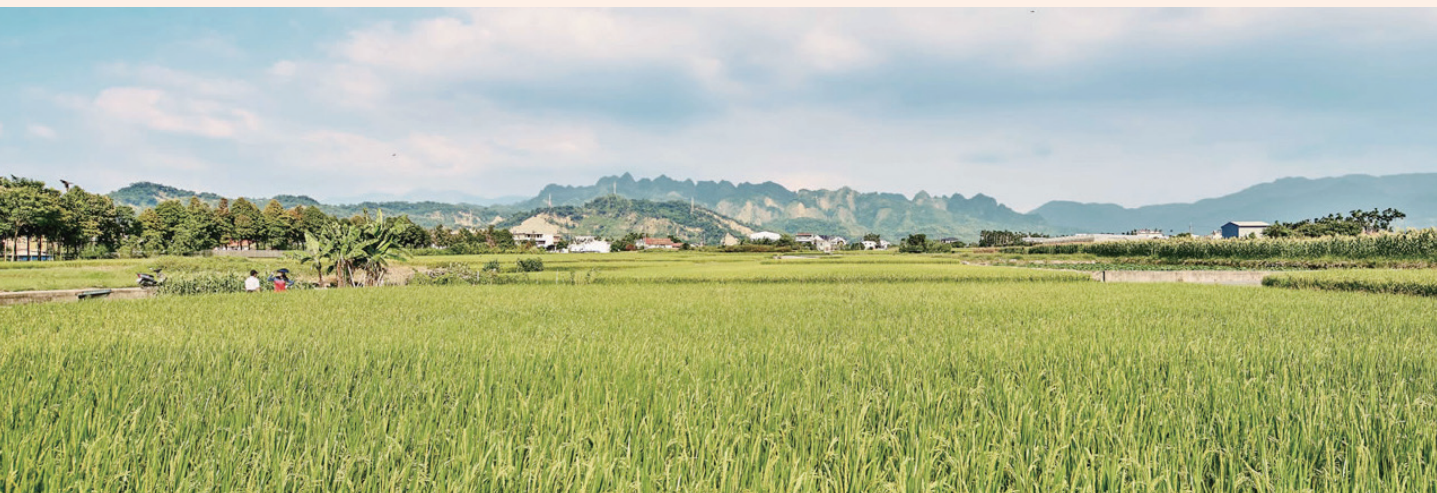
草屯 - 九九峰生態栽培區地理環境優越，適合水稻栽培

草屯鳥嘴潭生態米在與農業生態結合的部分也別具用心，透過與九九峰自然保留區相連的河谷平台，當地水田的農業生態也與九九峰的淺山環境緊密相連，豐富的鳥類資源成為鳥嘴潭生態米最好的生態推廣大使，包括屬於臺灣特有種的臺灣山鷓鴣與有穩定留鳥族群的東方蜂鷹，這些活用當地環境的物種也成為水田生態中不可或缺的一環，也為鳥嘴潭生態米賦予更高的生態價值，讓消費者在購買產品時有多一層支持當地生態多樣性的意義。