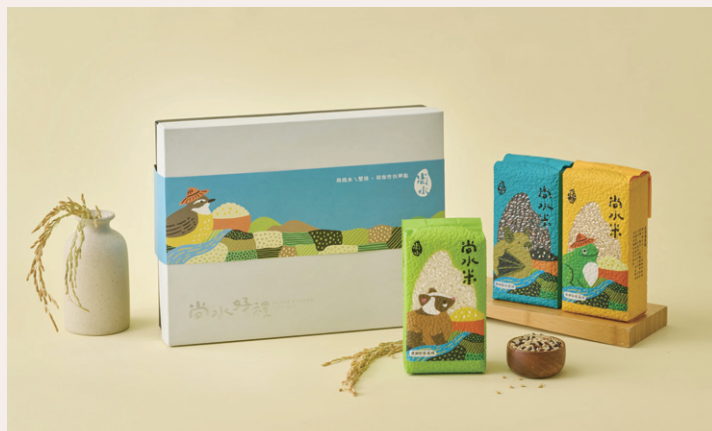
溪州尚水友善耕作田區環境自然，提供生物喘息空間，米禮盒的包裝將生態元素融入