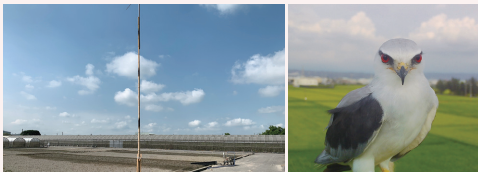
田間架設高度約 8-10 公尺的鳥類棲架 (左) 吸引黑翅鳶 (右) 前來停駐與獵捕

近年來國內積極推動有機及友善環境耕作農法，種植面積逐年遞增，但多數農田欠缺生態平衡原理的這一塊拼圖，而生態田埂及鳥類棲架正好能夠弭平這個缺口。透過田埂植被營造、保留野生草花或移植天敵偏好棲息的植物，讓害蟲天敵發揮生物防治功效；於田埂邊設置高、低棲架，吸引捕食性鳥類停駐與協助獵捕農田的野鼠與害蟲，均已證實是可行的管理作為，對於增加農田生態系統的生物多樣性扮演積極的效益。