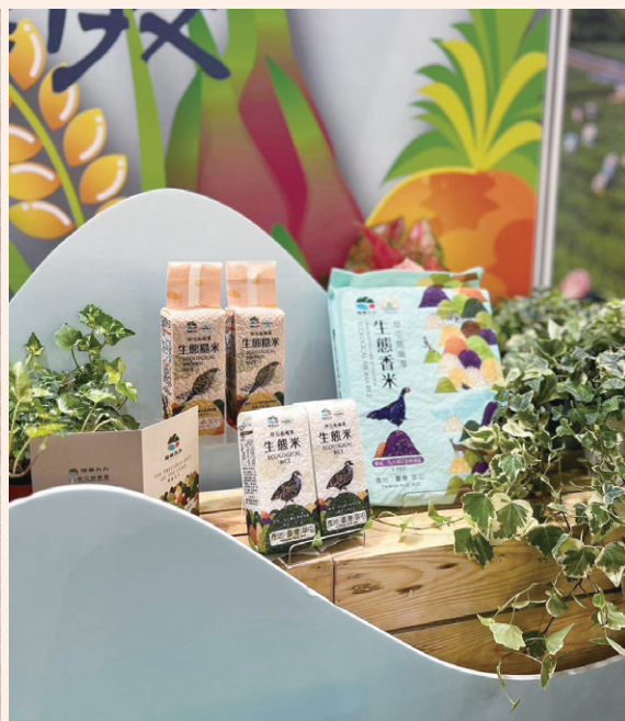
草屯鎮農會推出鳥嘴潭生態米，以當地生態的明星物種融入包裝米的设计，並積極地參加展售會活動推廣相關產品