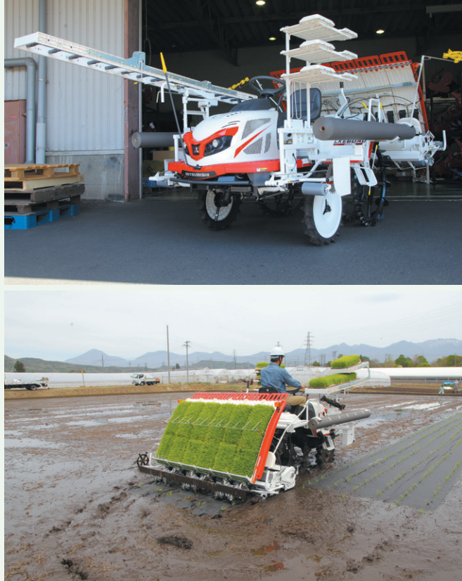
自日本引進的紙蓆插秧機，透過覆蓋可分解之紙質抑草蓆，大幅減少雜草萌發機會（圖 / 雲菱農機股份有限公司）