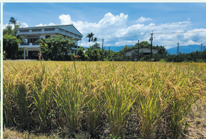
本場適合有機栽培的新品種台中秈 199 號 (左) 與台中 200 號 (右) 於田間推廣的生育狀況