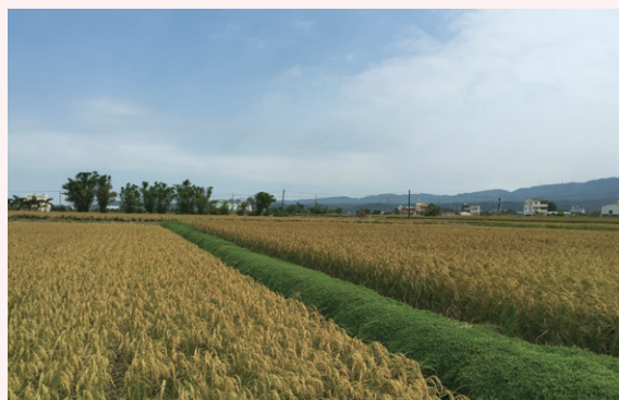
覆蓋蠅翼草的水田田埂