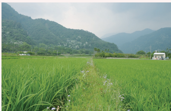
長滿自然植被的水田田埂

移植的草生植被以具匍匐特性、競爭能力強、繁衍速度快、具明顯花器的雙子葉植物為原則。經常使用的種類包括：蠅翼草、心葉水薄荷、鴨舌廣等。先將標的草生植被扦插種植於約長 60 公分、寬 30 公分的育苗盤內，約 2 個月滿盆後，再分切為長寬均約 15 公分的植被方塊，並移植田埂。移植前，田埂原生植被務必完全清除，盡可能將地下部一併移除，以提升移植草生植被的競爭優勢；或可委請代工業者使用築田埂機械修築田埂。接著將草生植被方塊移植田埂，可種於田埂兩側，相距約 45 公分。移植後 2 個月即可完全覆蓋水田田埂。