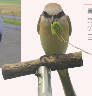
黑翅鳶於高棲架取食野鼠 (左)，紅尾伯勞於低棲架補食鱗翅目幼蟲 (右)