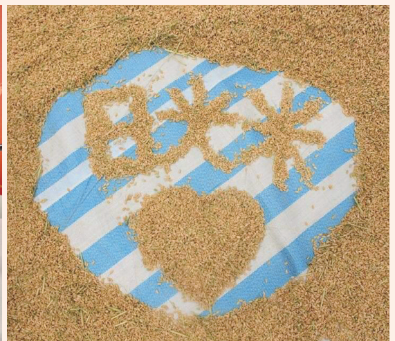
鹿光米獲得友善石虎農作認證，常受邀參與各式推廣活動，而日曬乾燥方式也是鹿光米最大的特色