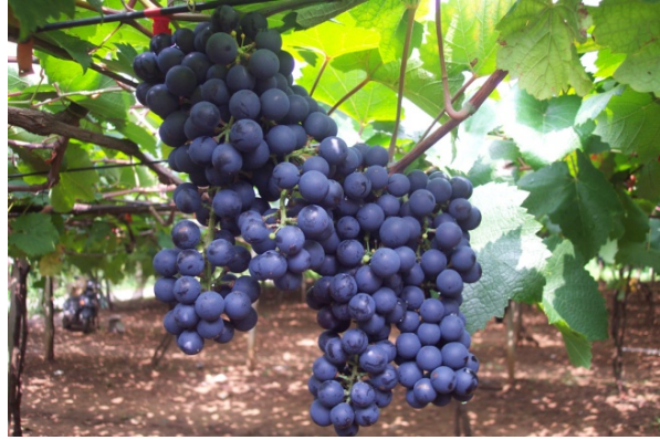
圖三、對照品種‘黑后’葡萄果穗