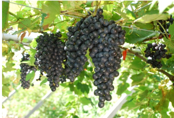
圖四、對照品種‘台中2號’葡萄果穗