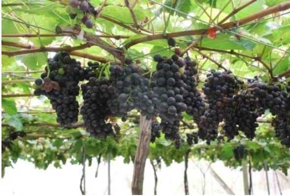
圖二、‘台中4號’葡萄果穗