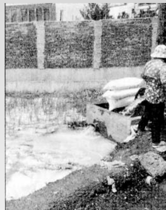
▲水稻生育期間不當施肥易造成 ▼水稻生育不良及破壞土壤生態