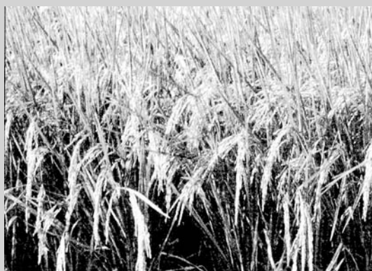
▲水稻合理化施肥成熟結穗

為解決土壤缺乏有機質，農田施用作物殘體、有機肥料等以增加土壤有機質含量，同時，亦可於冬季裡作休閒期間種植綠肥作物如苕子、埃及三葉草、油菜。減少耕作次數，儘量減少耕犁，減少土壤有機物質消耗，或栽培系統中採輪作制度栽培，有助增加土壤有機質含量。