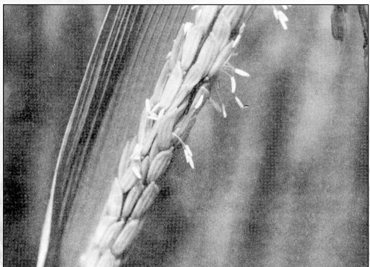
▲抽穗後穎花於每日上午8~12時開放，連續七天

6節位至第10節位發生（14~16葉的品種），對產量的助益不大，反以二次分蘗、甚或三次分蘗對產量的助益較大。此種由水稻莖節上長出葉與分蘗的生長時期，稱之為營養生長期，若任其隨意生長，不給予斷水、曬田的田間作業，則分蘗生長速率雖可逐漸減低，但二、三次分蘗可持續發生，然其對產量不僅毫無幫助，甚且影響稻株養分的分配、降低稻米品質，因此在分蘗盛期後，通常給予斷水、曬田處理；營養