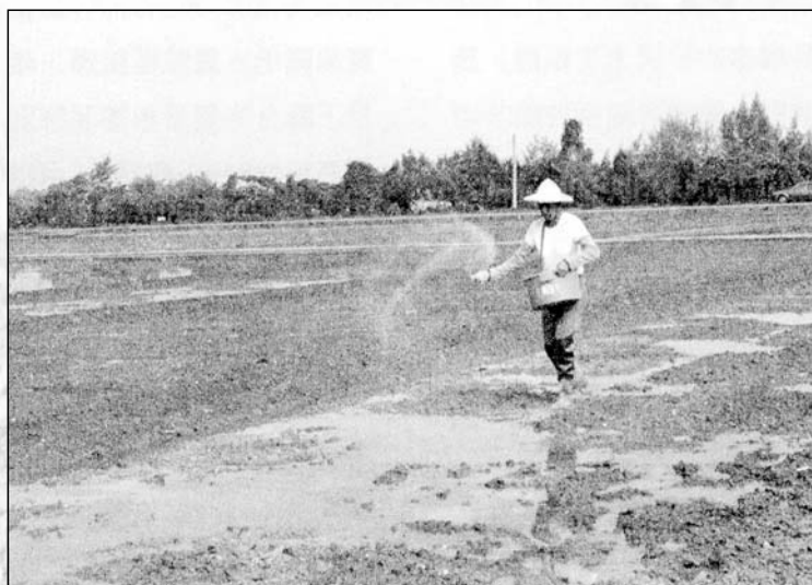
▲基肥於第一、二次整地間施用確保早期分蘖的發生