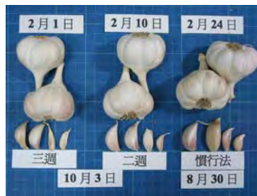
▲ 低溫處理大蒜結球早(圖中日期為種植時間)