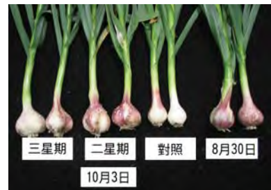
▲ 蒜種經低溫貯藏後蒜瓣分化較快