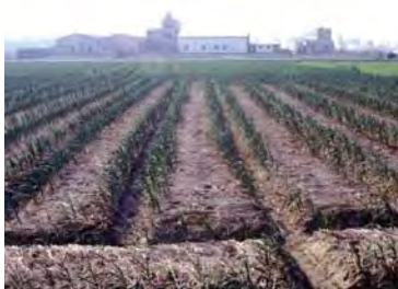
▲ 大蒜早植往往因高溫，造成萌芽不齊、生育不良及多缺株