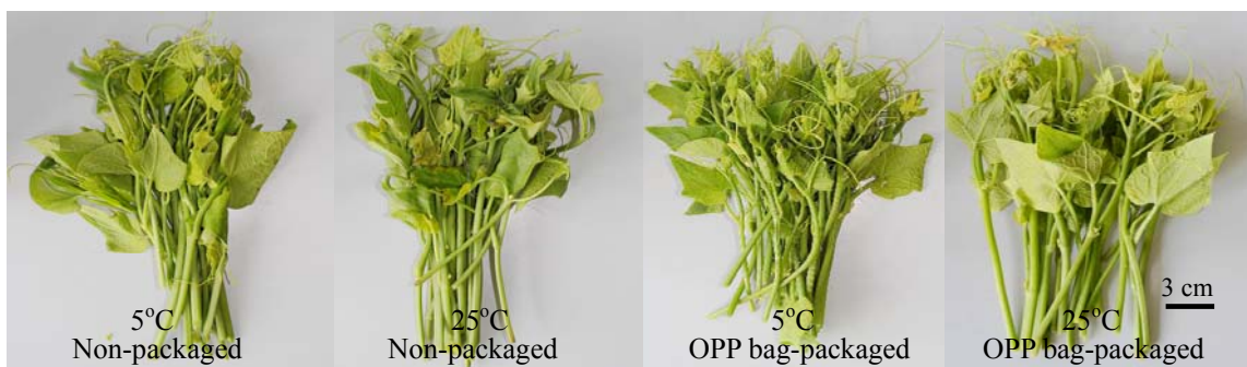
圖三、以不同包裝方式處理之龍鬚菜貯藏於5°C及25°C、2天後外觀差異。

在產品外觀表現方面，5°C貯藏2天後未包裝和OPP包裝並無明顯差異，唯未包裝處理植株有些許失水萎凋現象，但在25°C貯藏下，相較於未包裝之龍鬚菜植株明顯萎凋、黃化甚至腐爛，OPP包裝僅有部分新葉黃化(圖三)。