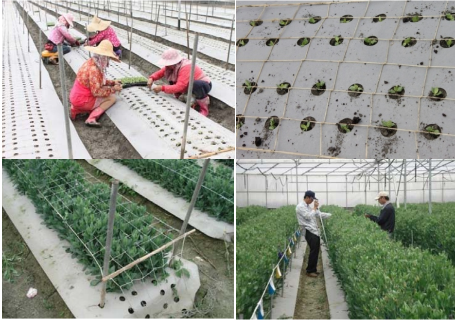
圖一、洋桔梗畦面覆蓋試驗。

嚴重，平均每平方公尺有18.2株葉尖枯萎，然而有畦面覆蓋處理可減少5株，如以1分地計算約可減少4,800株。鑽石白粉及牛奶泡芙的葉尖枯萎問題較不嚴重，畦面覆蓋處理同樣可以減少葉尖枯萎的株數。推測其原因可能是畦面覆蓋的土壤水分含量及溫度變化都較為穩定，不易造成植物生理障害反應。另畦面覆蓋處理的植體本身含鈣量也較高(表二)。