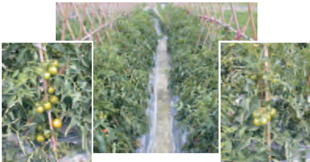
▲PGPR 菌株能提昇田間栽培番茄生長速率及提早開花結果(左：處理組, 右：對照組)

些菌株在田間作物生長環境下，仍能克服土壤中其它微生物的影響，而與作物根系結合而發揮作用。綜合上述產量資料與根系群集菌量之相關性，發現能群集於根系又維持較高菌量之菌株促進番茄生長及提昇產量效果較佳，且在夏季高溫環境下仍可促使番茄生長及提升特級果產量，故這些 PGPR 菌株除可減少青枯病菌危害外，並可促進番茄之生長、產量及品質，為番茄栽培上克服環境及病害限制因子的重要微生物資源。