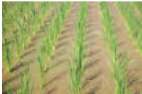
▲滿江紅放植於茭白筍田生長覆蓋情形