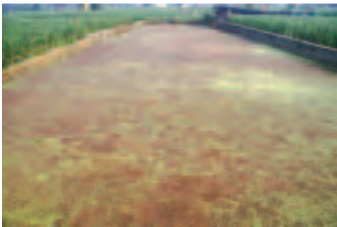
▲氣溫不適，滿江紅呈紅色