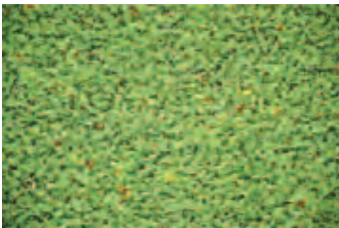
▲滿江紅養殖生長情形