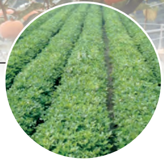
▲合理化施肥落花生生育情形

根據農糧署資料顯示以及實地了解結果，台灣農民的施肥量是偏高的，施肥過量不但會造成土壤酸化，貧瘠化的作用，破壞台灣的生態環境，更使作物生長不均，而造成農作物減產現象及農民損失，因此，採用土壤合理化施肥在本省是刻不容緩的課題。