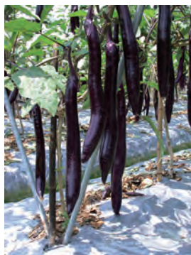
圖 3. 依茄子合理化推薦肥料施用量，即可充分供應茄子生育所需之養分。