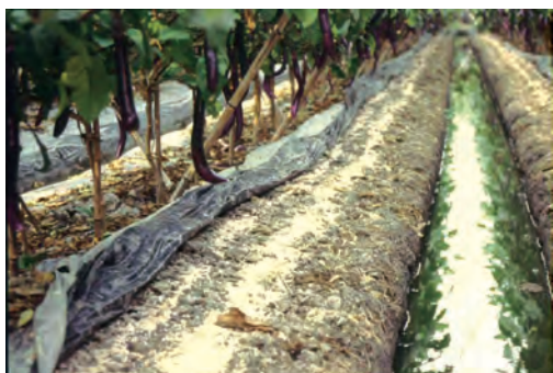
圖 1. 為避免肥分流失，宜混合掩埋土壤中或以塑膠布覆蓋方式，將可以發揮最大肥效。

氧化鉀 1,780 公斤是過高了，往往有需要除摘葉片，以抑制營養生長過旺，既浪費肥料及無法提昇品質。如有任何茄子合理化施肥之問題，歡迎各位農民朋友來電洽詢台中區農業改良場蔬菜研究室戴振洋，電話 04-8523101 轉 251 或 e-mail: taijy@tdais.gov.tw 均可。