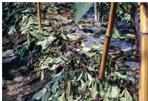
圖 2. 茄子如肥料過度使用，需要除摘葉片，以抑制營養生長過旺，既浪費肥料及無法提昇品質。