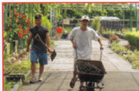
步驟二 運送砂土當底層