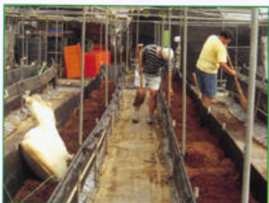
步驟九 將環境清理