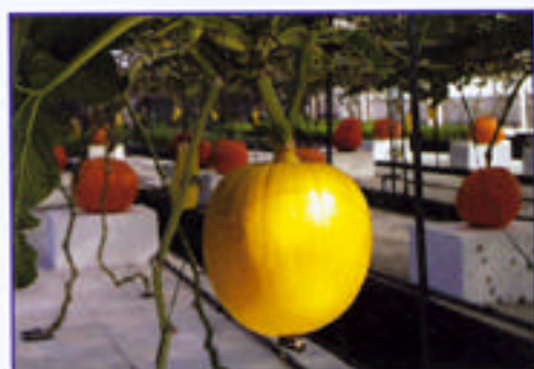
中改一號介質栽培大南瓜