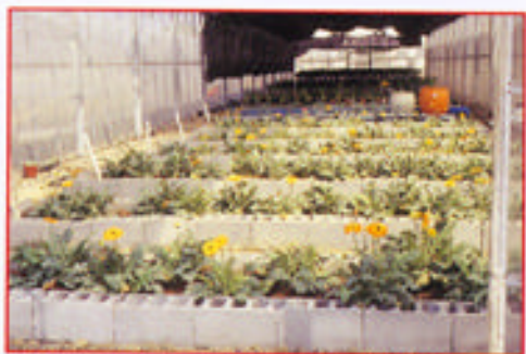
利用本土化有機介質栽培非洲菊