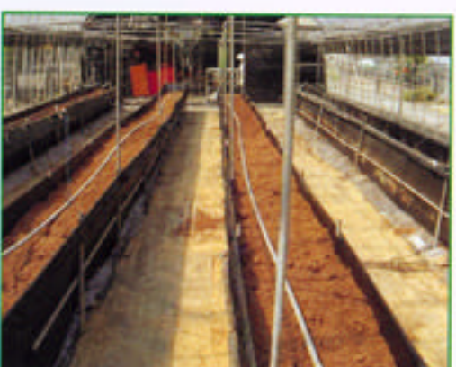
步驟十 介質耕設施完工情形