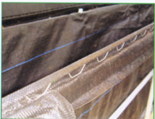
步驟七 利用壓條固定