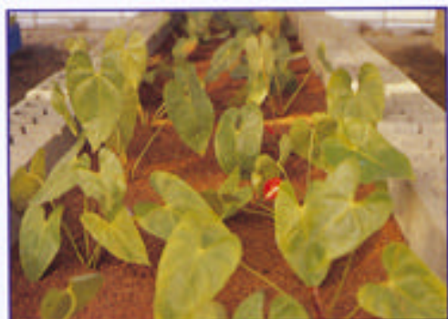
利用本土化有機介質栽培火鶴花