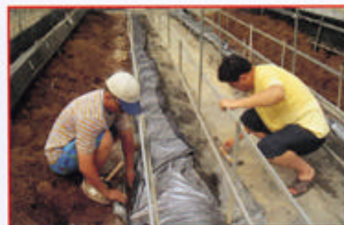
步驟四 覆蓋塑膠布