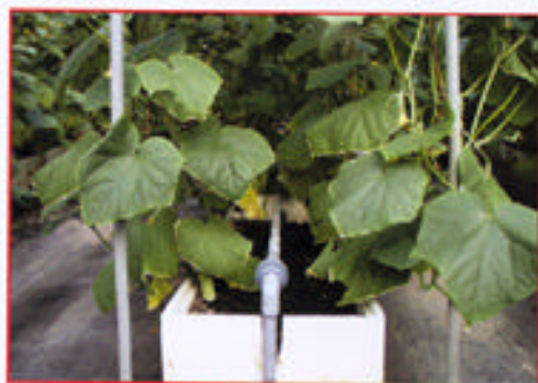
利用廢棄之保利龍箱當栽培床