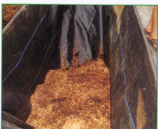
步驟八 將介質放入植床中