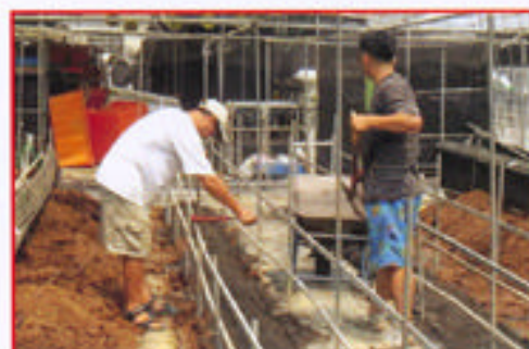
步驟三 平鋪砂土於底層