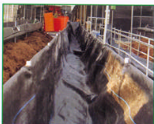
步驟六 將雜草抑制席當植床