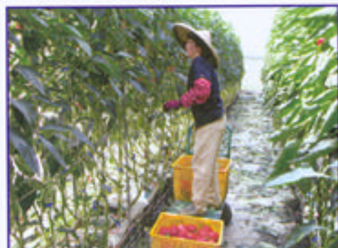
利用進口介質包栽培甜椒