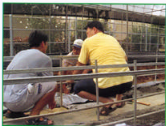
步驟五 用粗鐵線將塑膠布固定