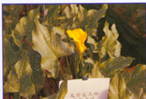
利用本土化有機介質栽培彩色海芋