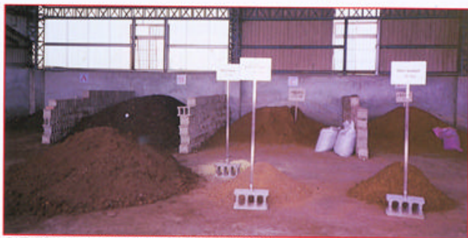
利用堆肥法可以將有機廢棄物轉化製成有機介質