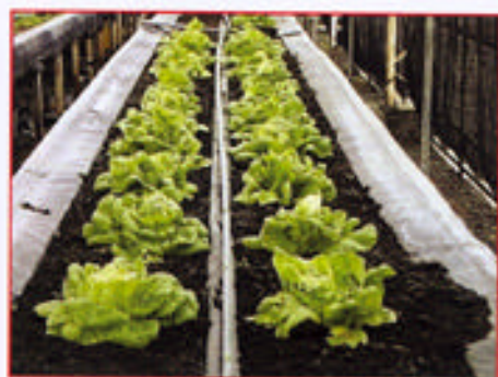
中改一號栽培結球萵苣