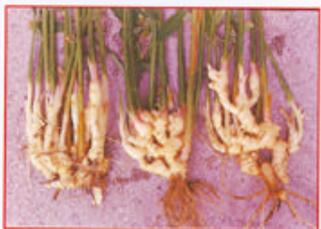
利用本土化有機介質栽培嫩薑