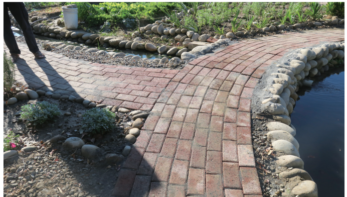
平穩的鋪面，提高居民使用療育庭園安全性