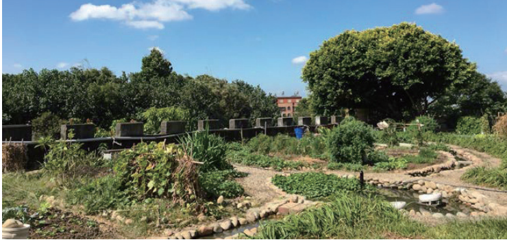
山陽社區開心農場規劃前現況，步道為碎石，用圓石區隔，雨天泥濘及濕滑，安全性較低