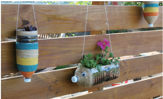
區隔資源回收站與療育庭園之南方松牆面，可展示居民療育活動作品