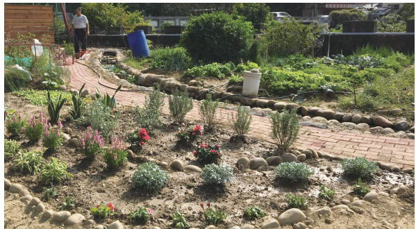
開心農場入口處，設置迎賓香草植物區