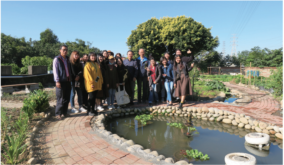
開心農場療育庭園由本場、台灣農村發展規劃學會、朝陽科技大學及山陽社區發展協會攜手完成