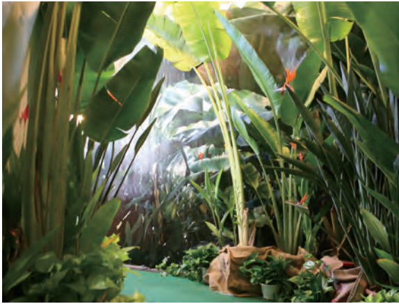
圖 4 聽覺區以旅人蕉環繞步道