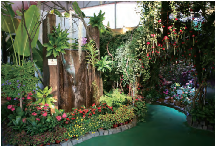
圖 2 本場展區入口完成圖