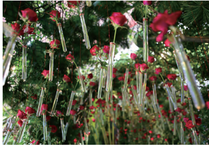
圖 3 嗅覺區以試管玫瑰切花妝點

玫瑰拱廊呈現，拱廊長度約 4 米，並以玫瑰花香作為此區的呈現重點，讓參觀者體驗被浪漫花香包圍的嗅覺饗宴；聽覺區（圖 4）呈現出熱帶雨林的蟲鳴鳥叫，以高大的旅人蕉環繞步道型塑雨林的蓊鬱感，並利用隱藏式音箱播放鳥鳴，帶來置身森林的聽覺體驗；觸覺區（圖 5）則是以植栽檯呈現各種居家觸覺療育的植物，讓參觀者體驗含羞草、過手香、薄荷植物的細微觸感，介紹這些植物的用途及栽培，讓有興趣的參觀者可直接於居家利用。