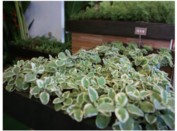
圖 5 觸覺區讓參觀者直接體驗植物觸感

班將設計圖完成，因此建議在規劃設計階段盡量投入時間去作通盤性的思考，會使布展過程順暢許多。