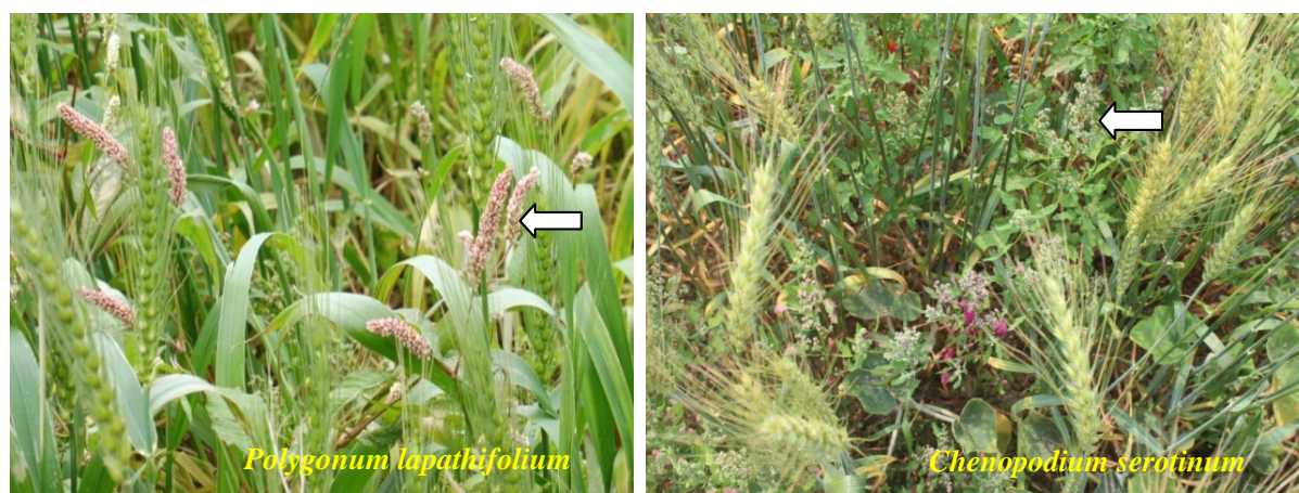
圖二、試驗期間小麥田區兩種主要雜草早苗蓼及小葉灰藿

Fig. 2. Two major weeds, Polygonum lapathifolium and Chenopodium serotinum found in wheat field during experiment period