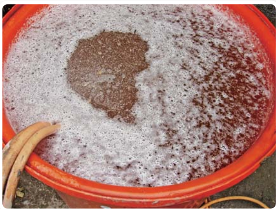
▲生物性豆粕液肥製作情形之一