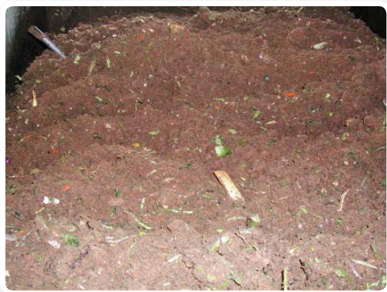
▲生物性果菜渣堆肥製作情形之一

化上市。本項新型生性堆(液)肥產品可以兼具改善土壤微生物性與堆(液)肥之雙重功效，由多項田間栽培試驗結果顯示，使用新型生物性堆(液)肥應用在玫瑰、草莓、彩色海芋、葡萄、甜椒、番茄、小胡瓜、玉米及枇杷等多種作物栽培，不僅能夠增加土壤有機質含量及磷、鉀含量等土壤肥力，且能增進作物生長、產量及養分吸收等效益，將可提供農友栽培應用之參考。