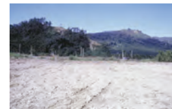
▲整地時須將殘株清除，翻耕土壤增加曝曬的機會