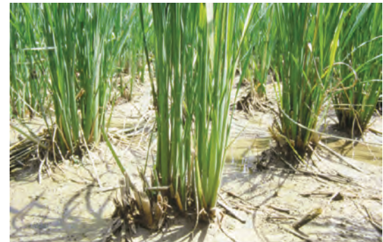
▲降低水位使低於採筍的傷口為防治基腐病的必要步驟