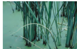
▲罹病植株新葉黃化內捲